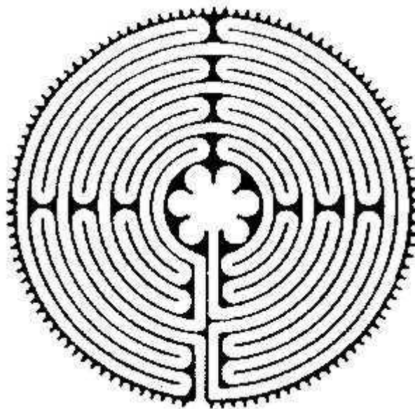
Labyrint van de kathedraal van Chartres

Kijk er goed naar: waar wordt het een obsessie en ga je vernauwen en waar blijf je in de openheid. Veel mensen zijn alleen met vorm bezig. En op aarde heb je vorm ook nodig. Je ziet mij hier nu staan als gestalte en ik zie jullie, maar we vergeten vaak te letten op de ruimte, de inhoud. M'n lichaam is alleen maar de vorm maar zonder inhoud is het niks, als ik hier sta zonder inhoud dan gaan jullie allemaal wat anders doen vanavond. Het gaat er om dat je vanuit de inhoud van je ziel en nog dieper vanuit de creatieve leegte vorm gaat geven.